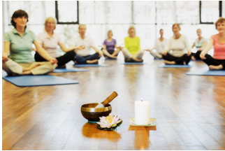
A. Zelck/DRK e.V.