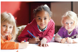
A. Zelck/DRK e.V.